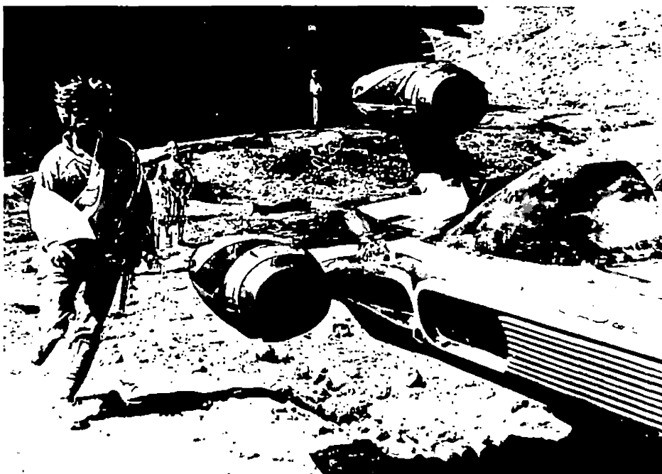
La Guerre des étoiles (Star Wars) de Georges Lucas.